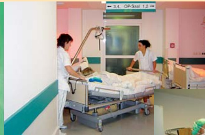
Transport in den zentralen operativen Bereich