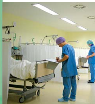
Übergabe an die Station