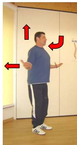
obere Rücken- muskulatur