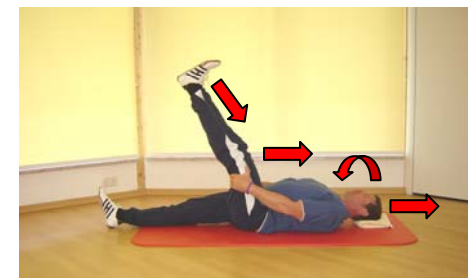
Dehnung der hinteren Bein- muskulatur