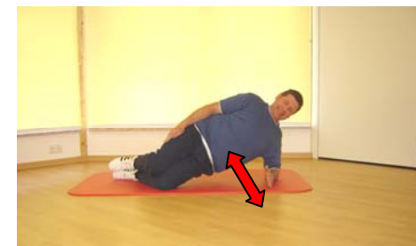
seitl. Rumpf- muskulatur