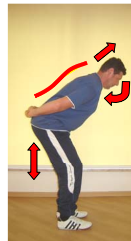
Rücken und Ober- schenkelmuskulatur