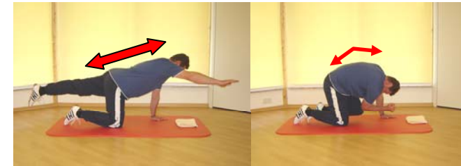
Rücken- und Bauchmuskulatur Koordination- und Gleichgewichtsschulung