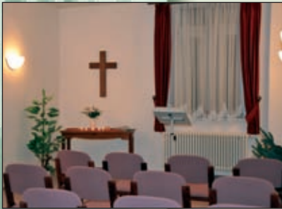
Raum der Stille