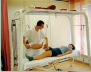
Behandlung am Schlingen- tisch