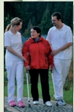
Gehparcours im Innen- und Außenbereich