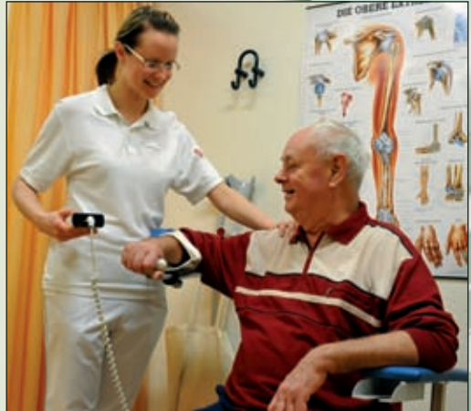
Behandlung an der Motorschiene